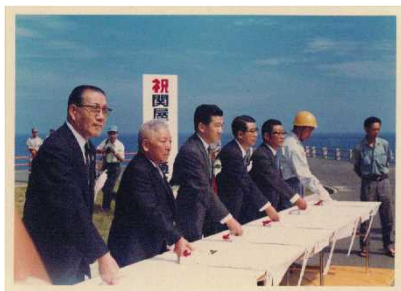
(参考) 50年前の通水式典の様子