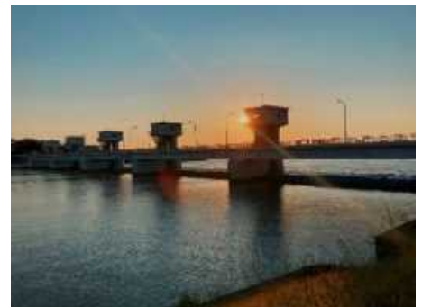
(参考) 夕日を背景に映える新潟大堰