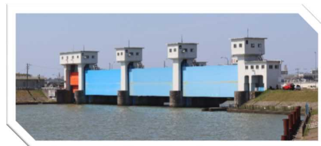
<写真：上段_新潟大堰、下段_信濃川水門>