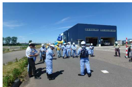
河川愛護モニターの方も参加しての安全利用点検の様子