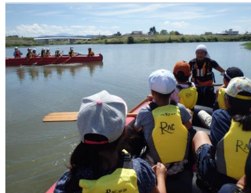
昨年の水生生物調査とEボート体験乗船より(五十嵐川、信濃川 三条市立大島小学校)

同時配布先 県政記者クラブ 新県政記者クラブ 新潟市政記者クラブ 新市政記者クラブ 三条市政記者クラブ