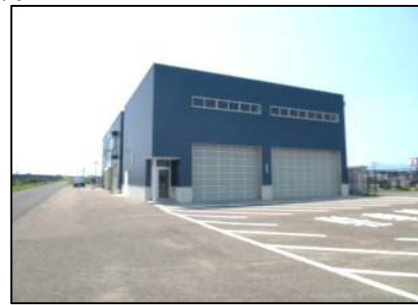
三条防災ステーションの様子