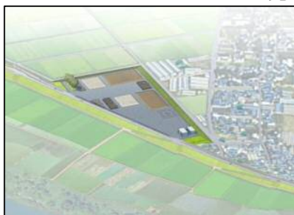
天野河川防災ステーション完成予想図