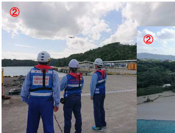
運天(うんてん)港ドローンによる調査