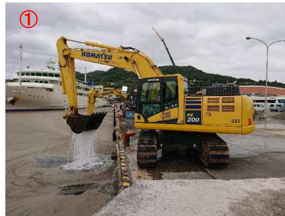
バックホウによる回収作業