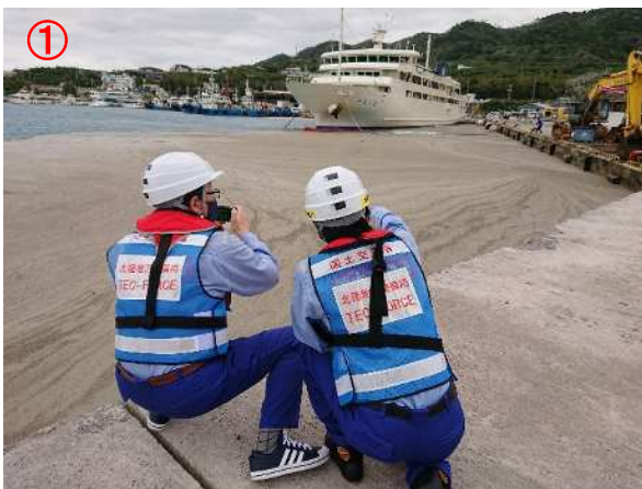
本部(もとぶ)港現地調査