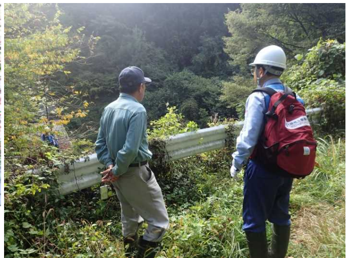
唐沢 地元住民聞き取り