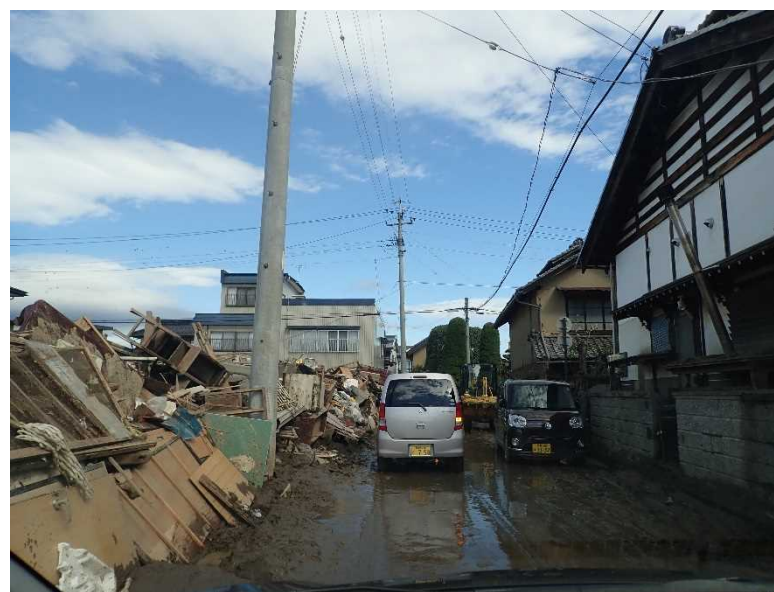
県道368号村山豊野停車場線 長野市大字津野地先