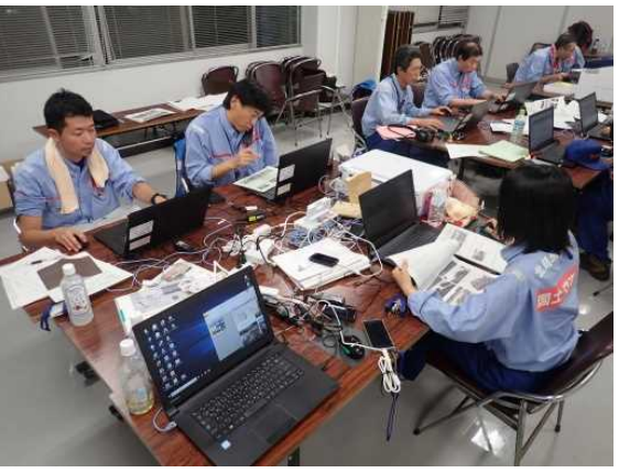
上田建設事務所にて内業