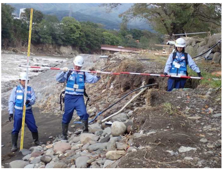
境橋下流左岸 被災箇所測量