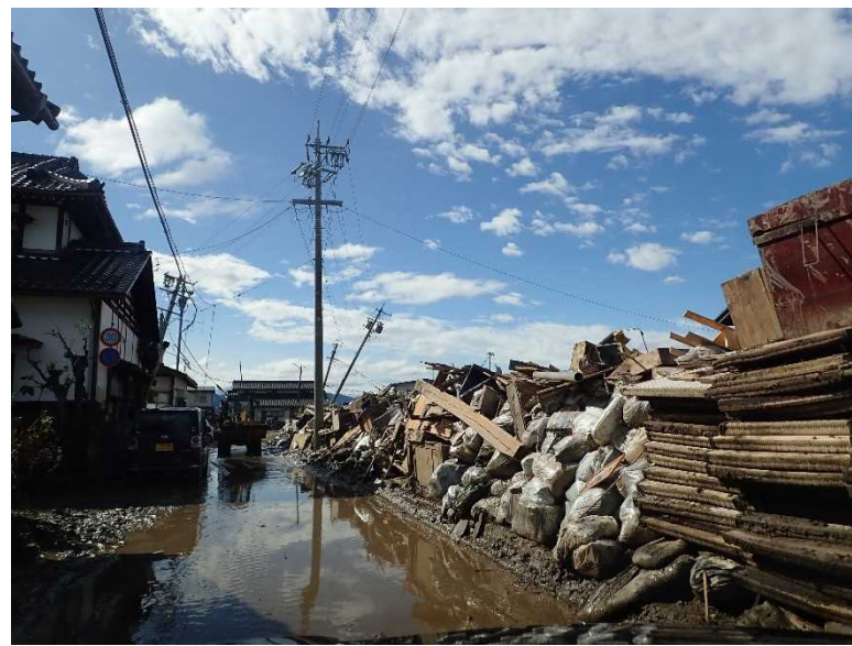
県道368号村山豊野停車場線 長野市大字津野地先