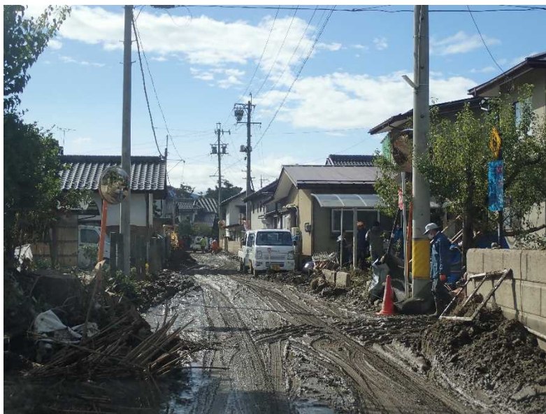
県道368号村山豊野停車場線 長野市大字津野地先