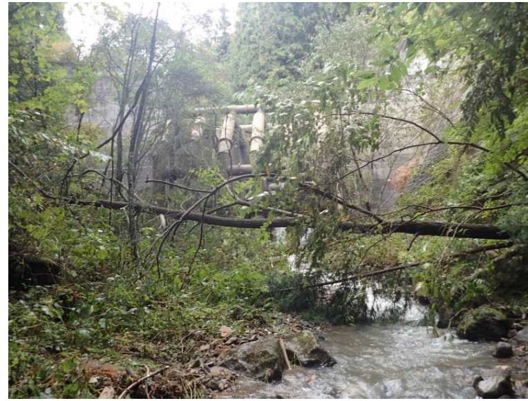
堤入谷川 現地調査