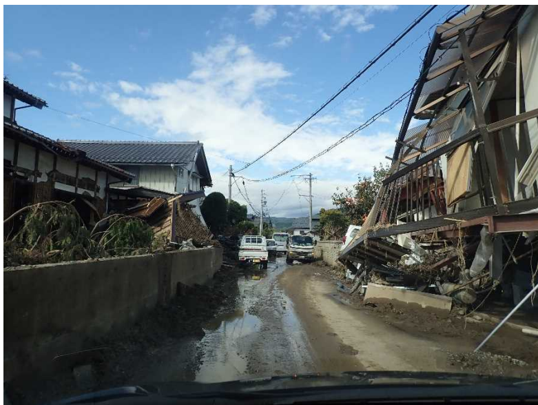
県道368号村山豊野停車場線 長野市大字津野地先