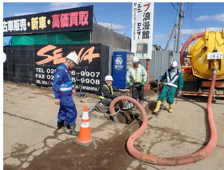
側溝清掃（国道18号 長野市大字赤沼地先）