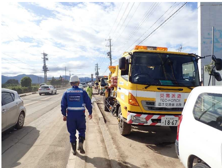
側溝清掃（国道18号 長野市大字赤沼地先）