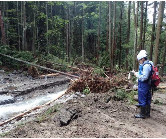
真田角間川 被災状況