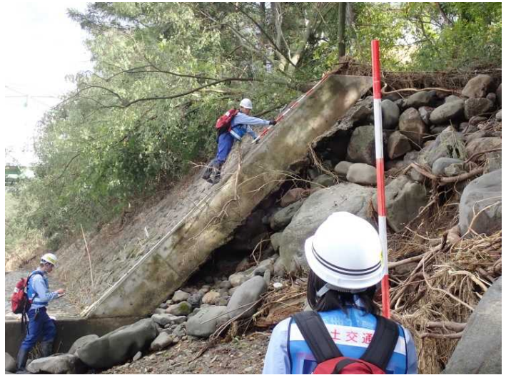
境橋下流左岸 被災状況測量