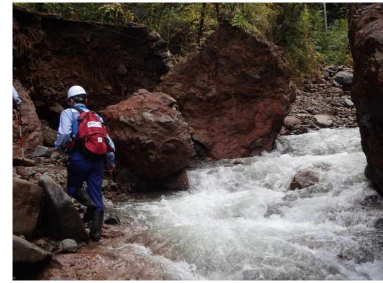
真田角間川 被災状況