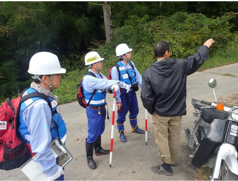
堤入谷川 地元住民聞き取り