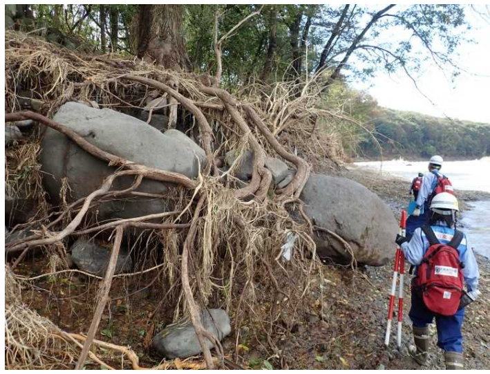
境橋下流左岸 被災状況踏査