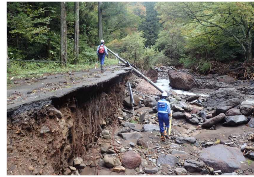
真田角間川 被災状況