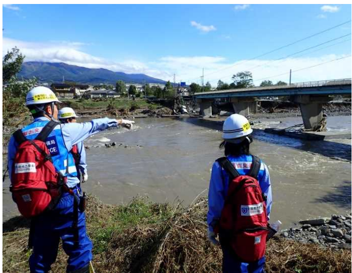
田中橋下流左岸 被災箇所確認