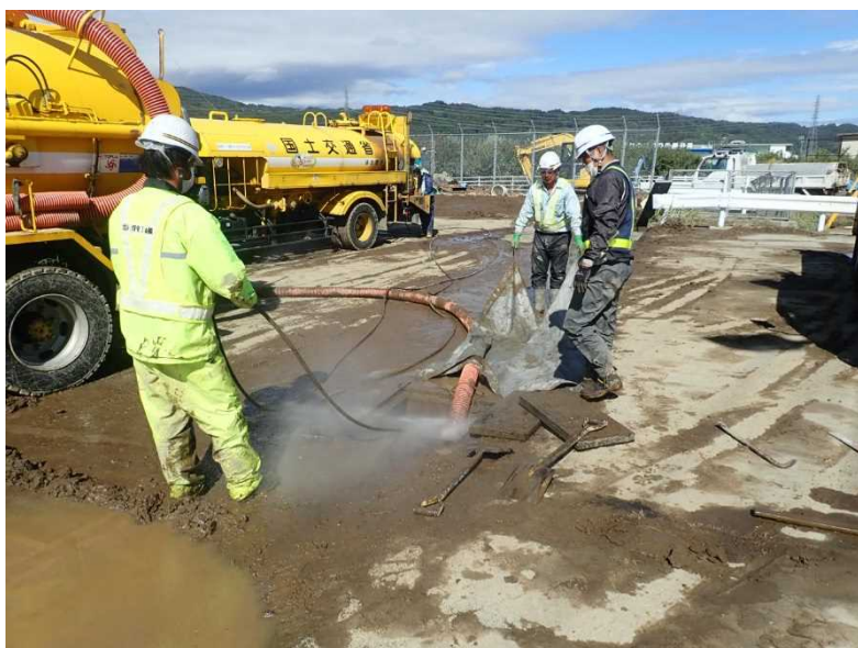
側溝清掃（国道18号 赤沼除雪ステーション）