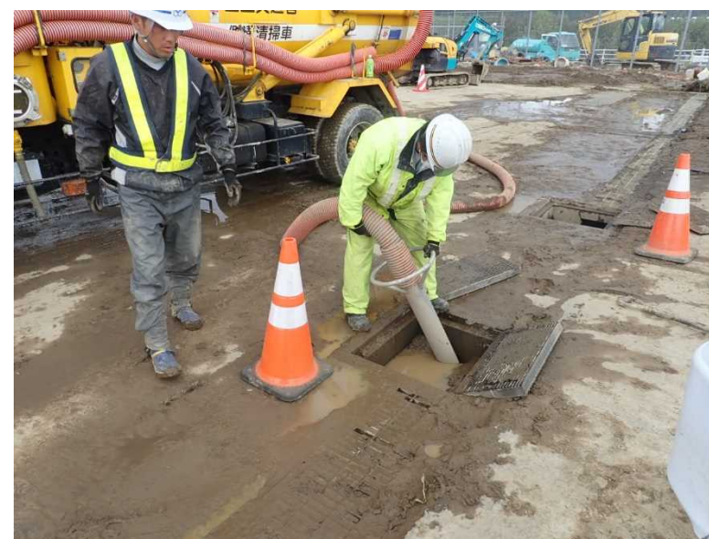
側溝清掃（国道18号 赤沼除雪ステーション）