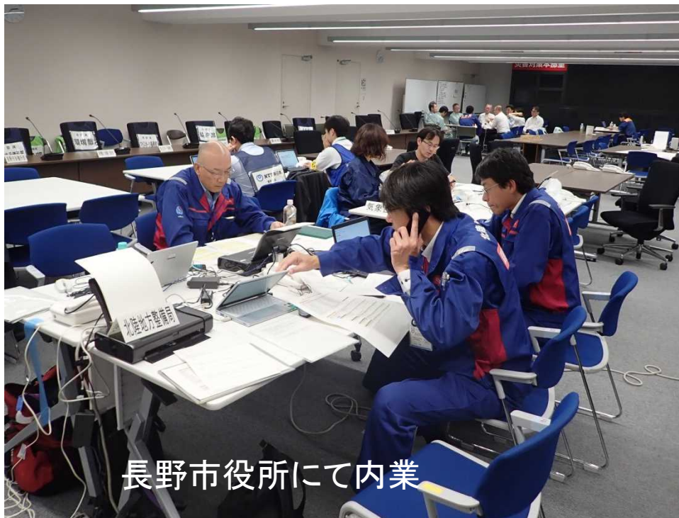
長野市役所にて内業