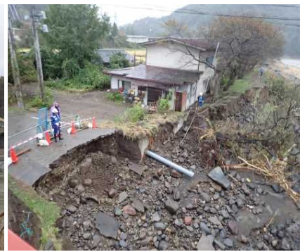
境橋下流左岸 被災状況