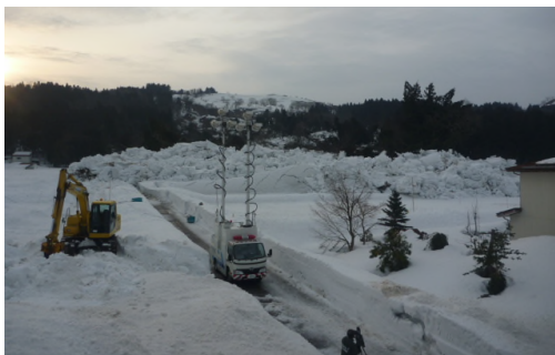
照明車の設置状況

【参考】「Ku-SAT」とは、通信衛星を利用した映像・音声・電話、FAX等の通信を行う装置であり、人力による持ち運びが可能です。災害現場にKu-SATを設営し、現場の状況を映像で災害対策本部等に送信することにより、災害の監視や復旧の計画等に役立っています。また、映像の受信も可能であることから災害映像の受信用としても幅広く利用されています。