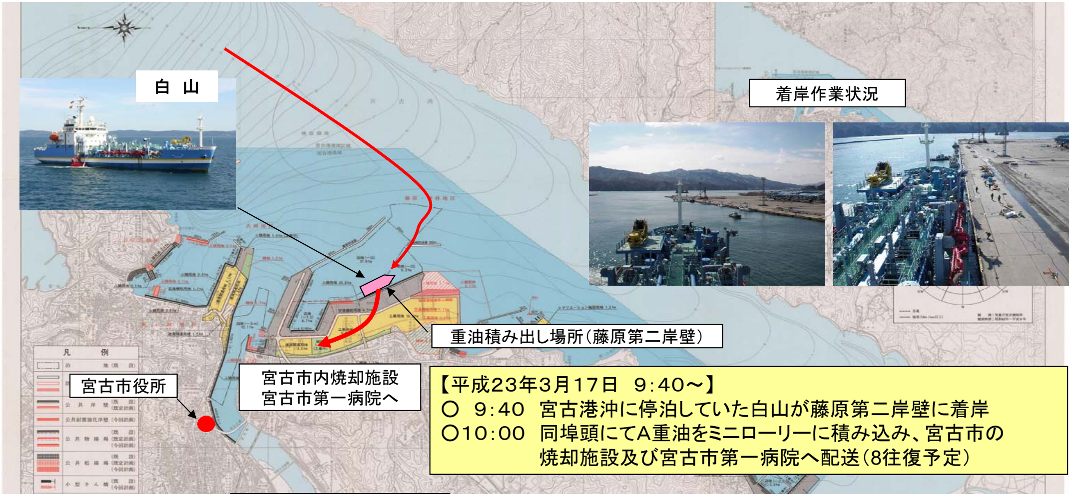
重油積み出し作業状況