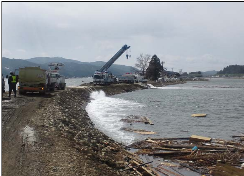
宮城県北上川大橋下流での津波による内水排水 (排水ポンプ車60m 3 /mmによる排水作業)