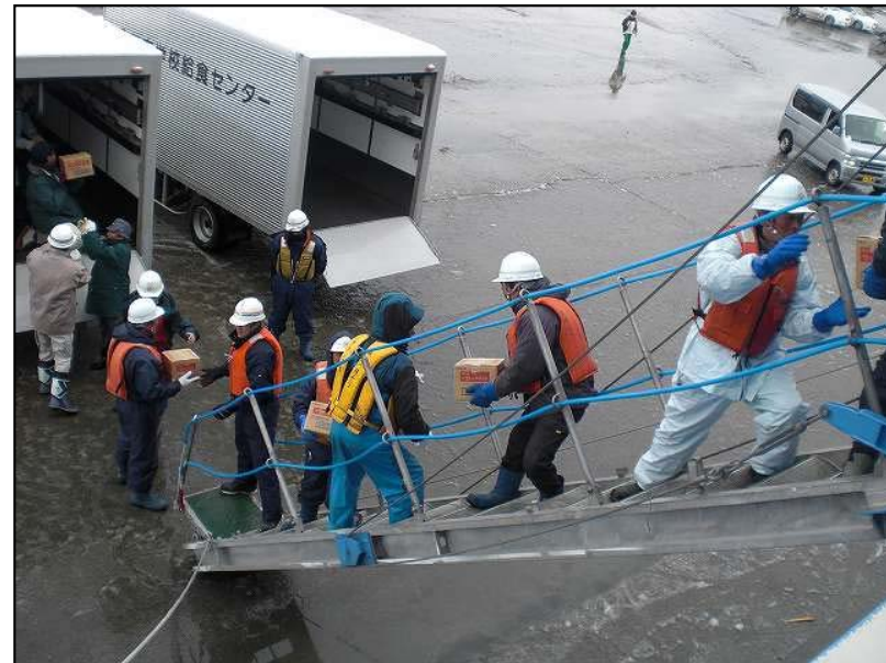
3月16日 岩手県宮古市への支援物資(米140kg、毛布200枚、水500ml、2,400本等)の陸揚げ作業