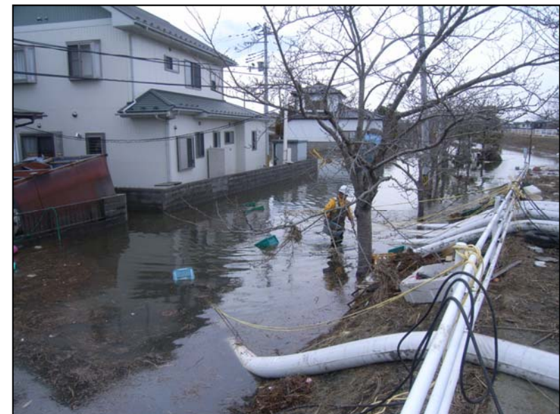
3/14 津波による宅地側の内水湛水状況