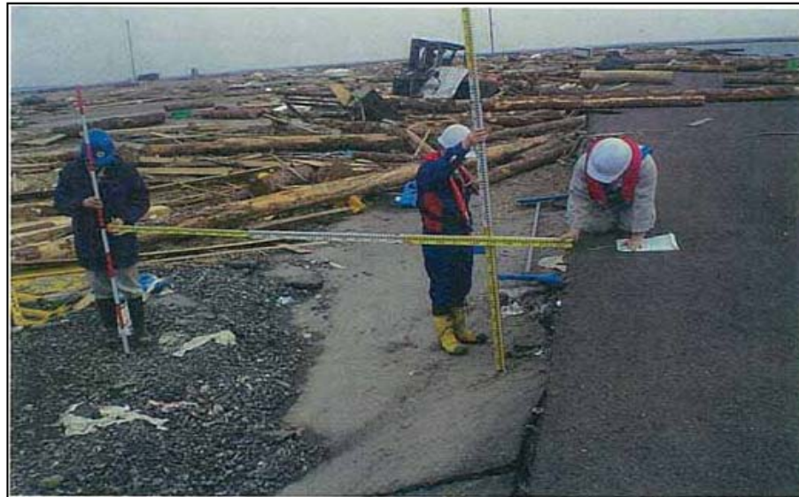
3/14 現地調査班(港湾班)活動状況 宮城県石巻港の港湾施設の被災状況