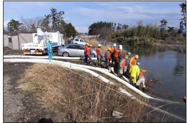
津波によるゴミ等の除去を行いながらの 排水作業を実施中