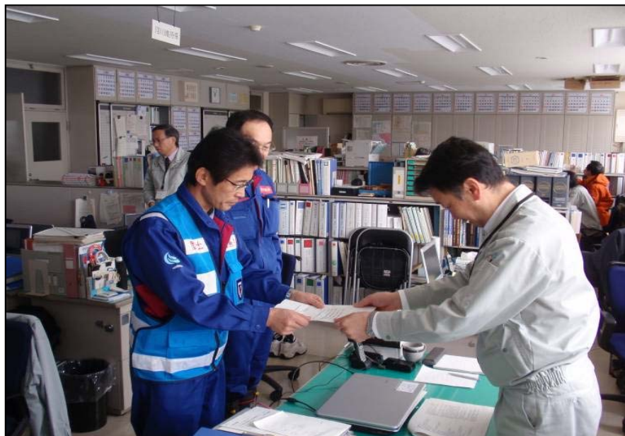
3/17 東北地方整備局へ調査報告書の引き継ぎ (河川・砂防班)