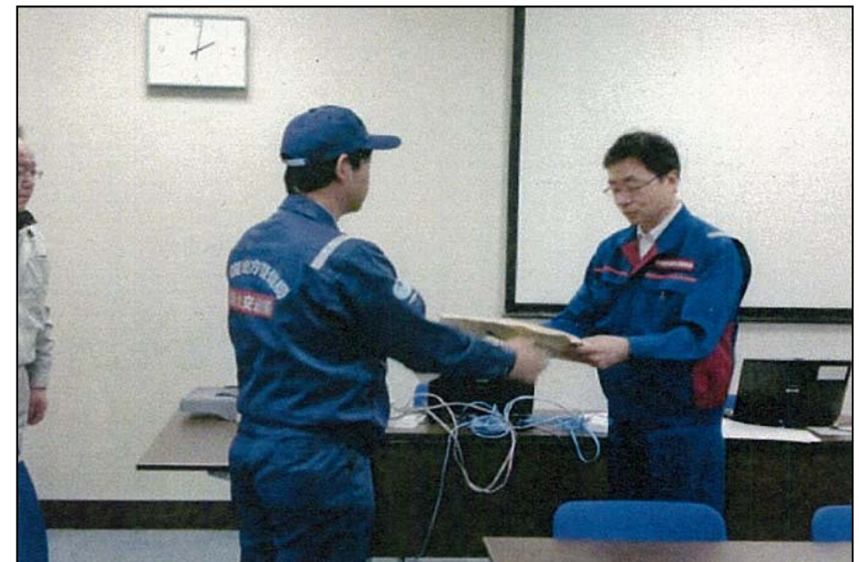
3/16 東北地方整備局へ調査報告書の引き継ぎ (道路班)