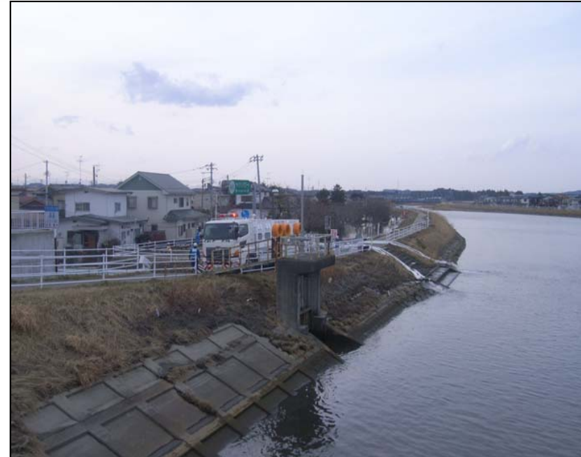
3/14 応急対策班(排水ポンプ車)活動状況 宮城県名取川下流左岸(排水ポンプ車60m 3 /mm)