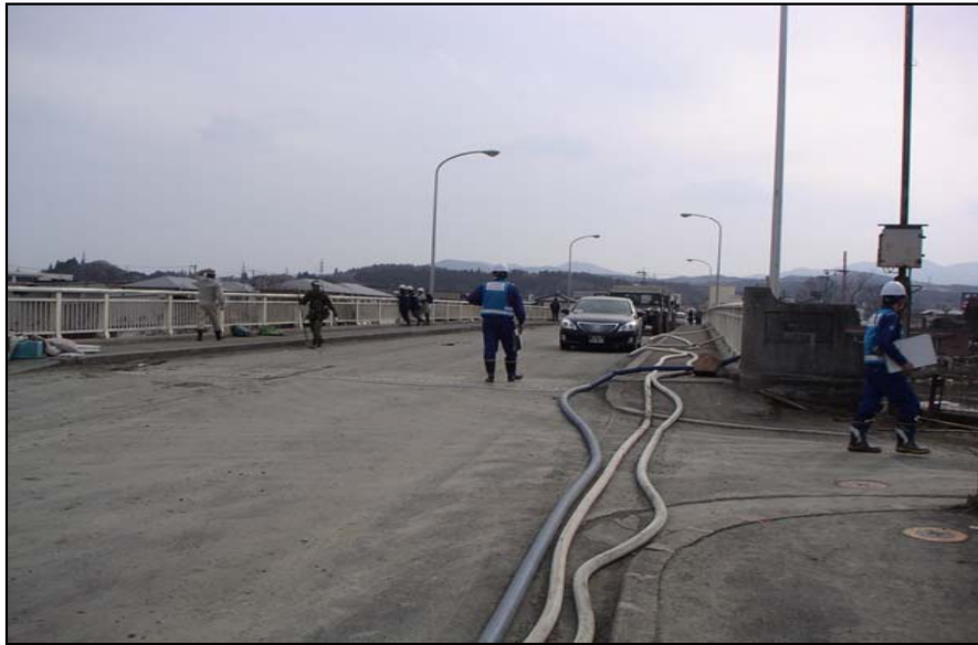
3/14 現地調査班(道路班)活動状況 気仙沼大橋被災状況調査