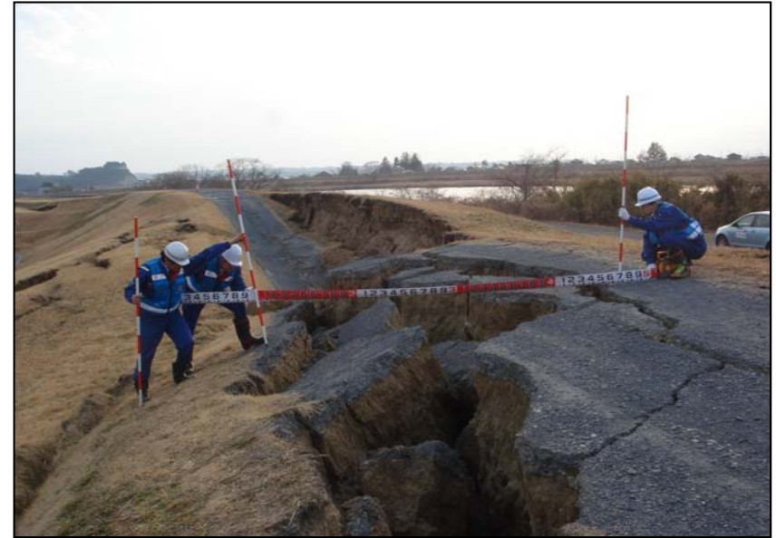
3/14 現地調査班(河川班)活動状況 宮城県鳴瀬川堤防の被災状況調査