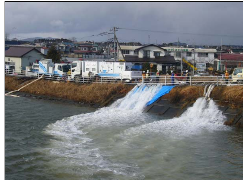
宮城県北上川淀川橋上流での津波による内水排水 (排水ポンプ車60m 3 /mmによる排水作業)