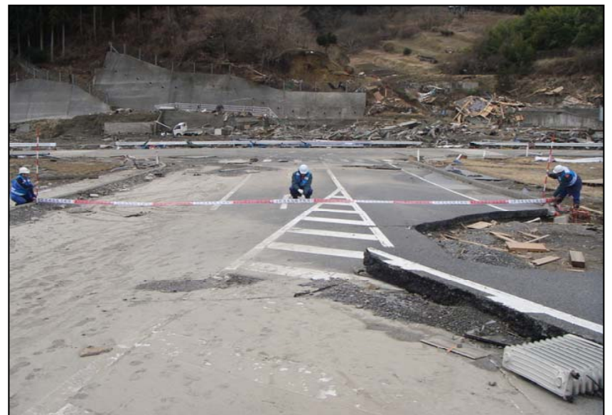
3/15 陸前高田における調査状況