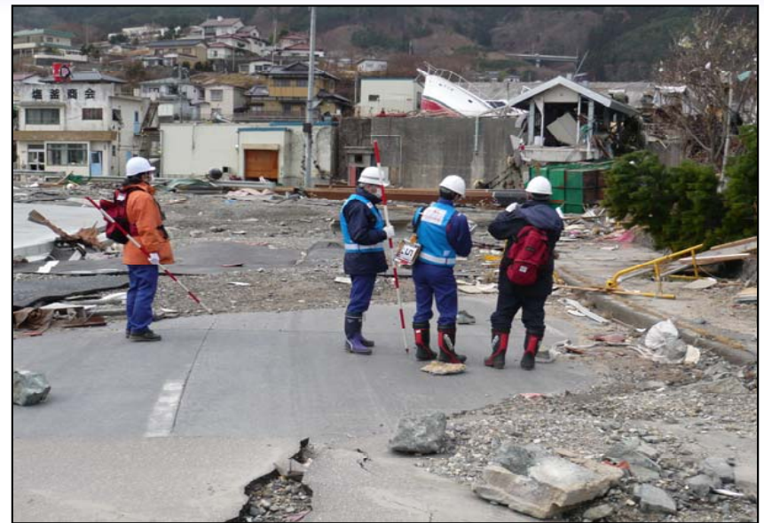
3/15 大船渡港へのアクセス道路の調査状況