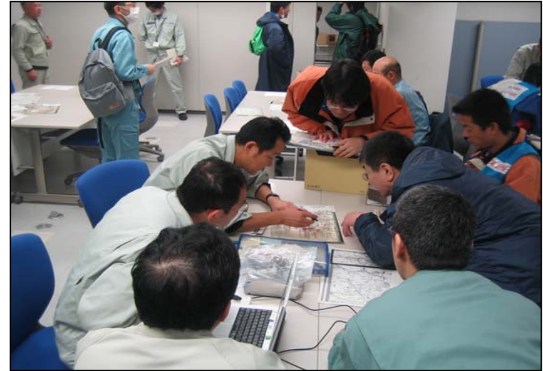
3/16 東北地方整備局へ調査結果の報告