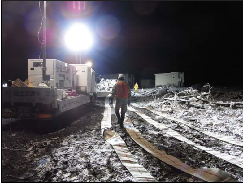
宮城県名取川での津波による内水排水 (排水ポンプ車30m 3 /mm及び照明車を利用し、 夜間も排水作業を実施)