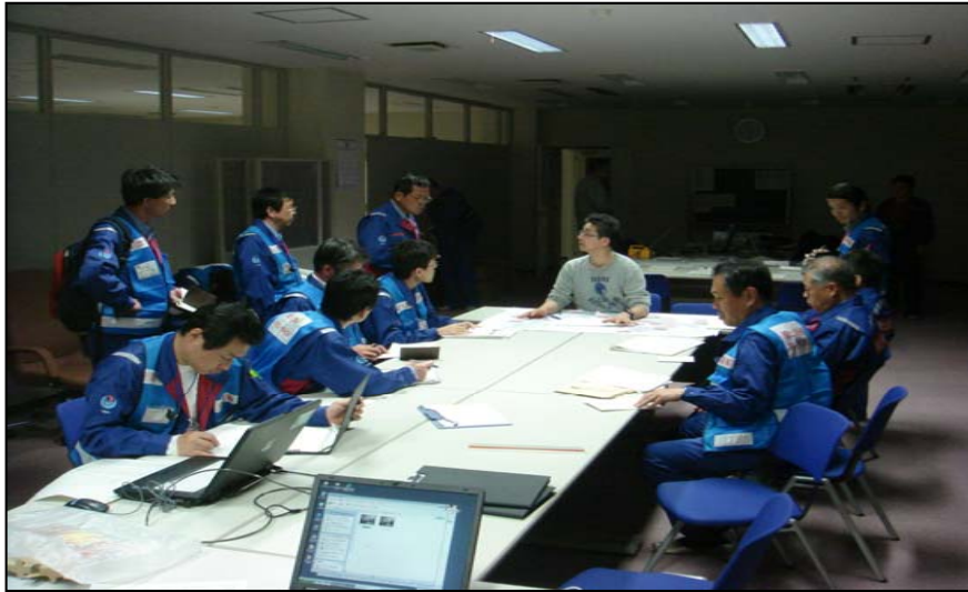
3/14 現地調査後ミーティング (北上川下流事務所 鹿島台出張所)