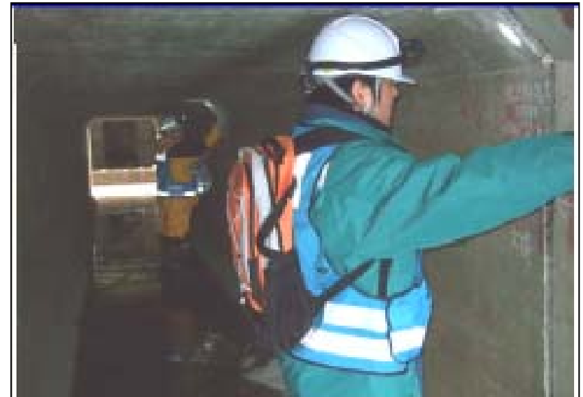
3/23 現地調査班(河川班)活動状況 樋管(BOXカルバート)の点検