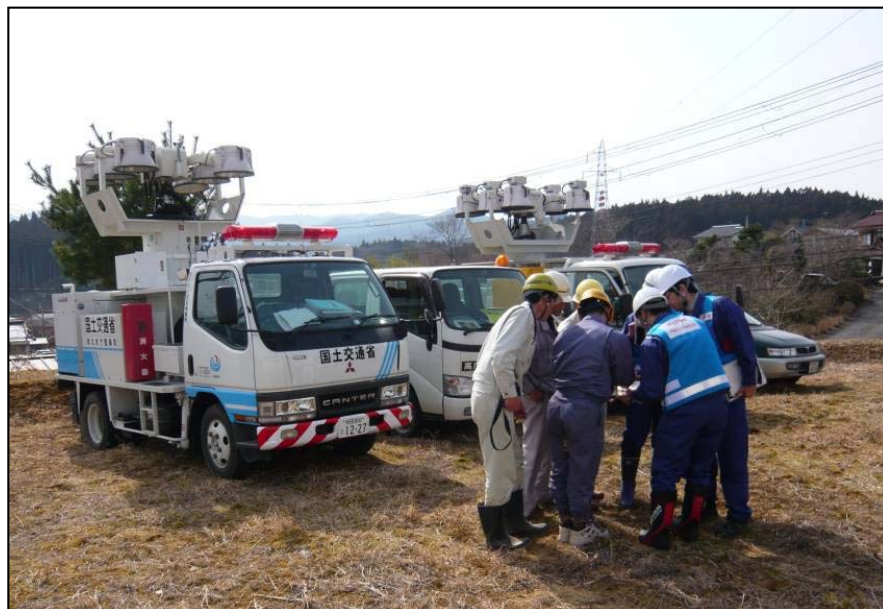
3/14 陸前高田市周辺道路の被災・通行状況の 聞き込み調査