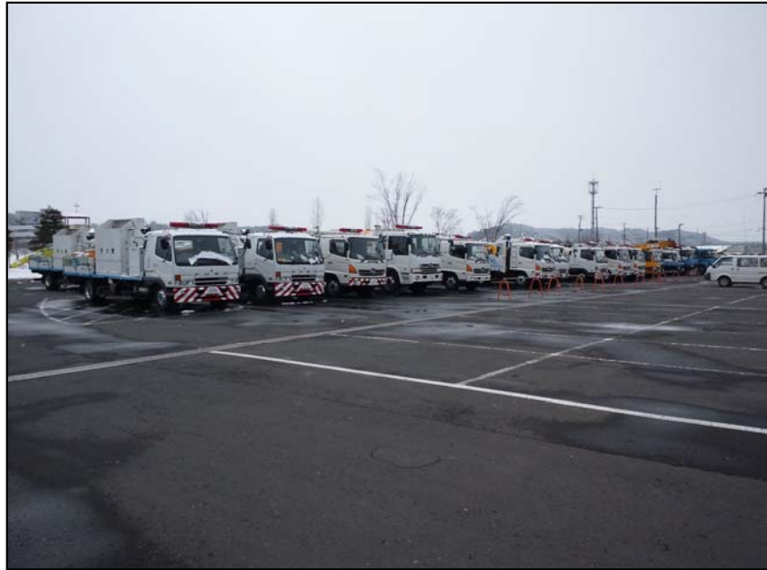
災害対策用機械(現地派遣状況) 岩手河川国道事務所一関出張所に配備された 排水ポンプ車、照明車