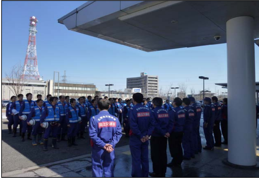
3/12 現地調査班出発式 北陸地方整備局