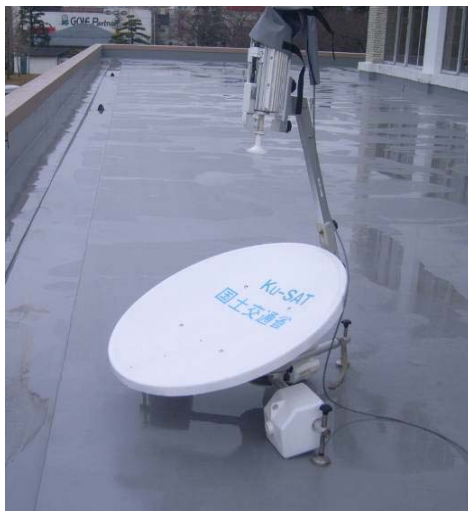
3/16 衛星小型画像伝送装置(KU-SAT) の利用(名取市役所)