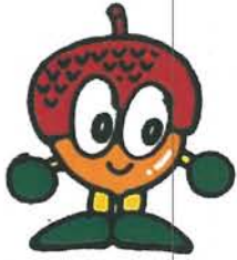
公園マスコットキャラクター 「ころりん」