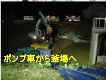
ポンプ車から釜場へ