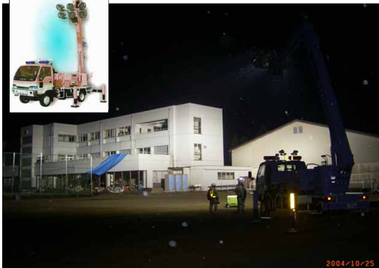
照明車配置状況（小千谷市：千田中学校（避難所））