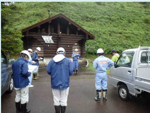
車両進入禁止杭(対処前)