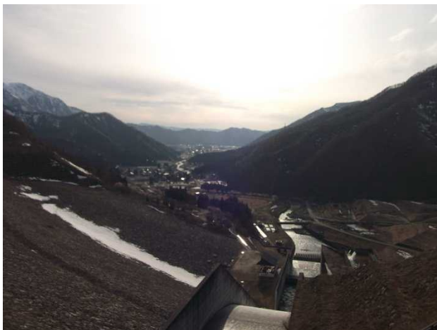
ダム下流の様子(管理所屋上より)