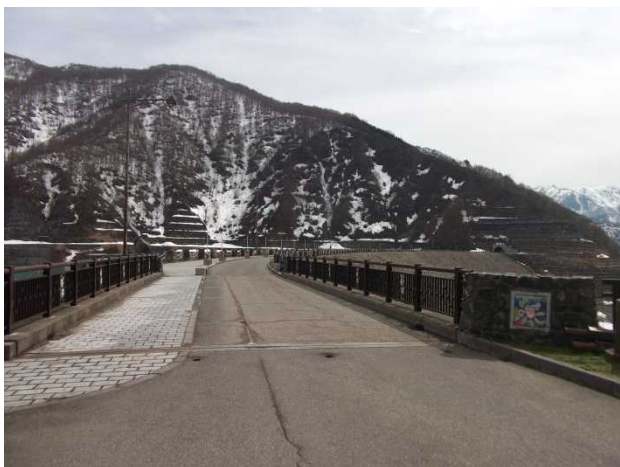
ダム堤体の様子(ダム右岸より)