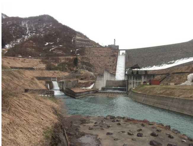
放流の様子(であい橋より)