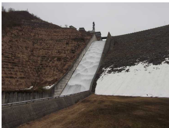
放流の様子(ダム堤体下より)