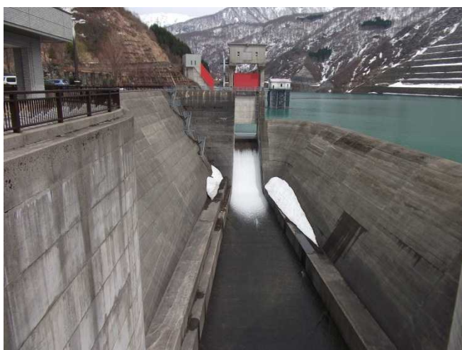
放流の様子(ダム天端より)