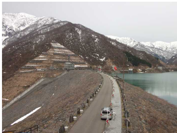
ダム堤体の様子(ダム左岸より)