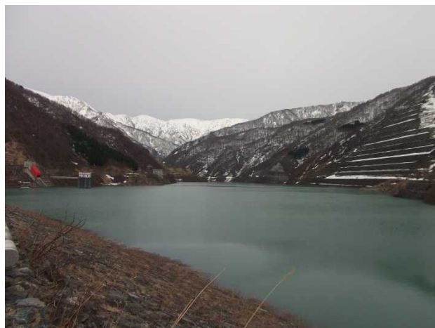
ダム湖上流の様子(堤体より)