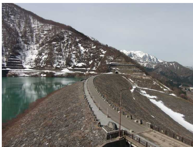
ダム堤体の様子(管理所屋上より)