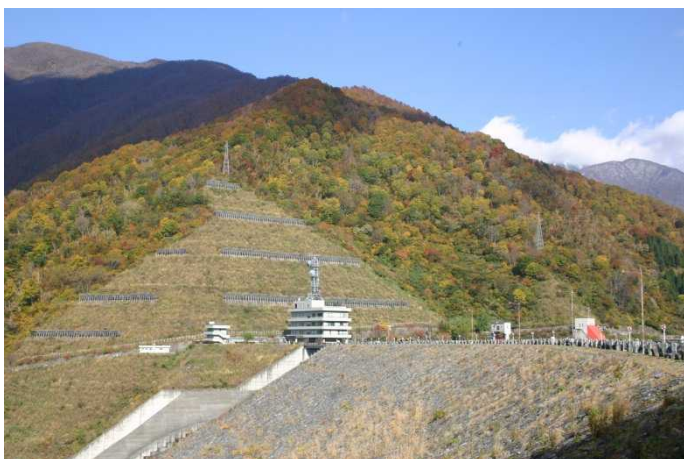
ダム周辺右岸(市道側)