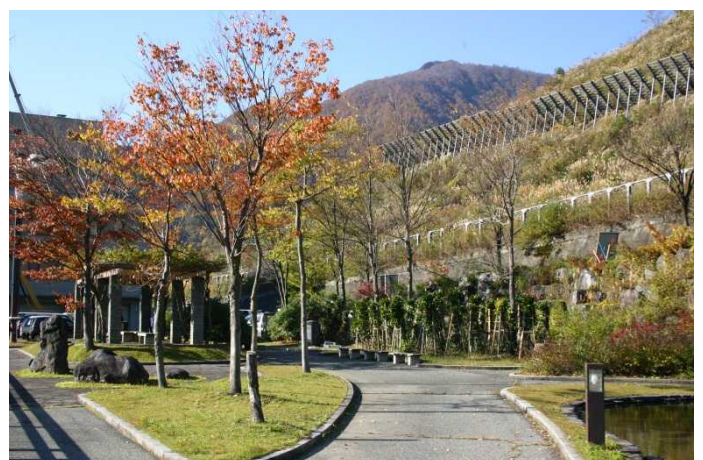
ダム管理所裏の公園