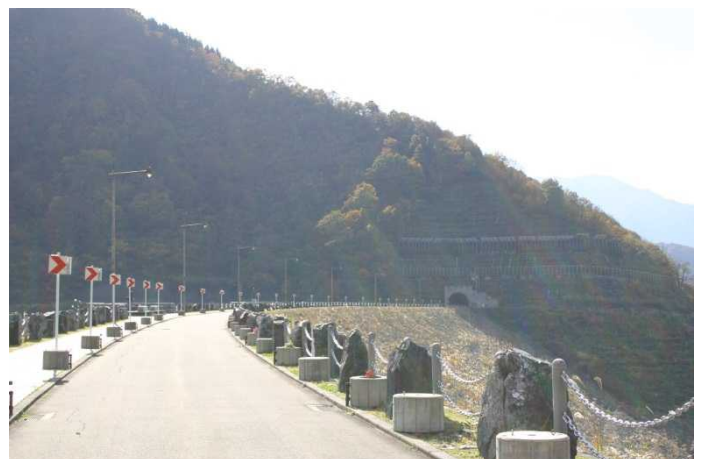
ダム周辺左岸(県道側)