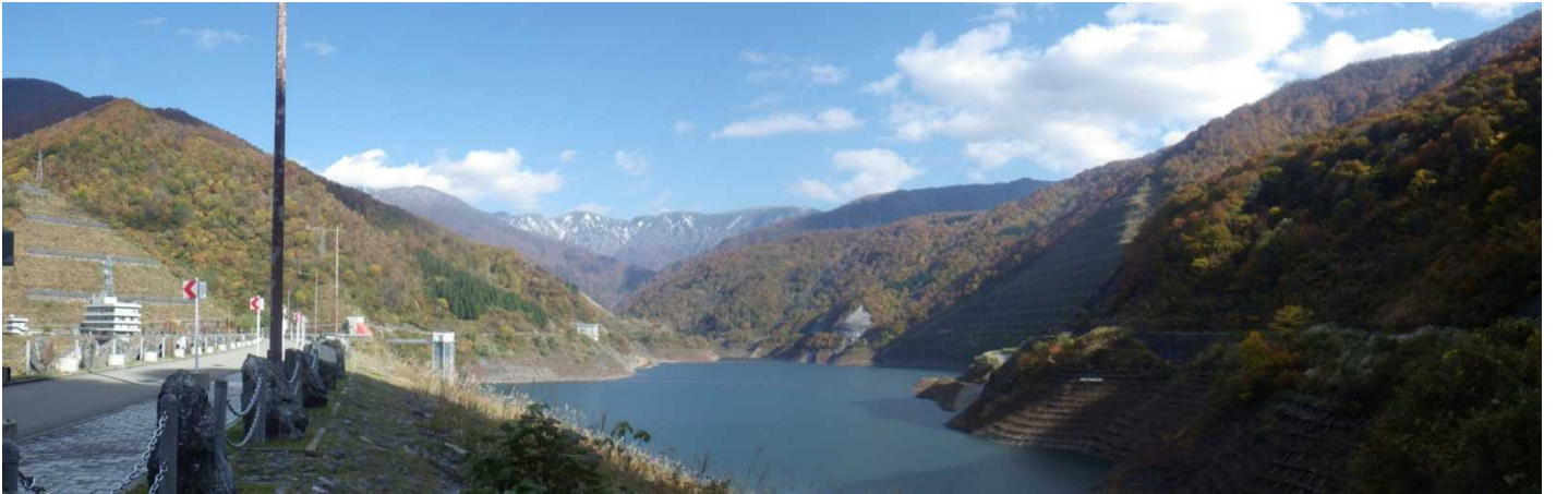
しゃくなげ湖(ダム天端道路より)