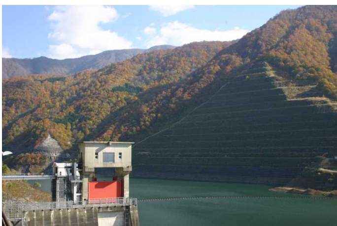
ダム左岸 ロック原石山跡地(県道側)