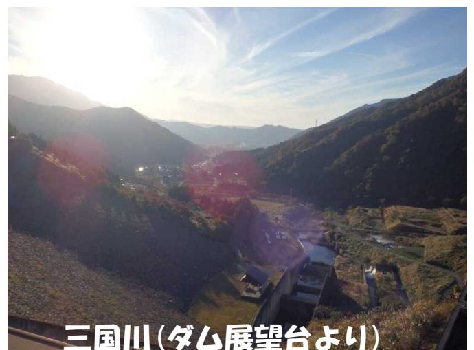
三国川 (ダム展望台より)