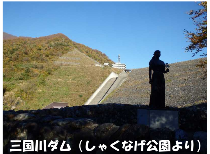
三国川ダム (しゃくなげ公園より)