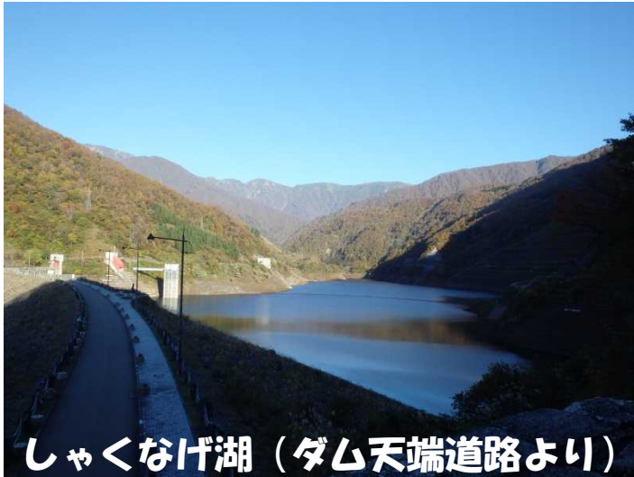
しゃくなげ湖 (ダム天端道路より)