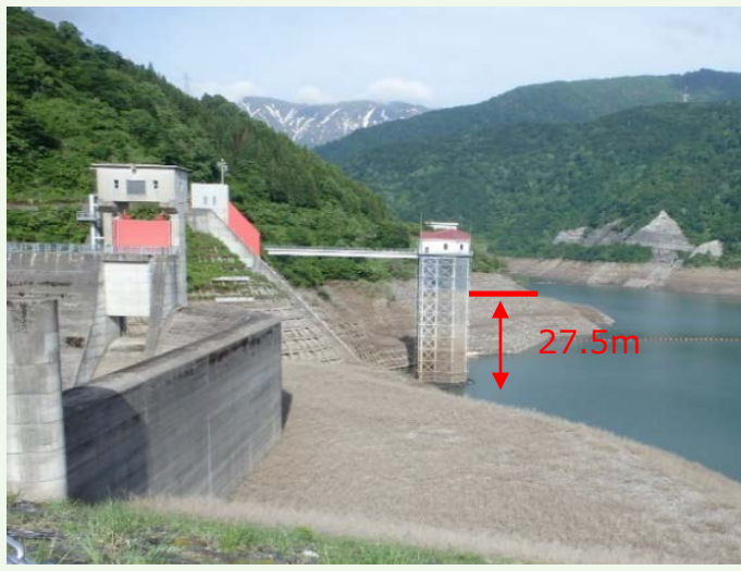
6月のダム湖の様子