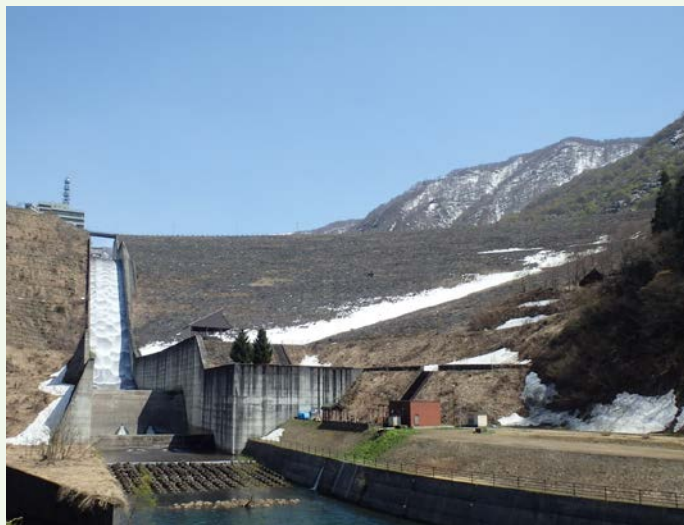
自然越流の様子(R3.4月撮影)