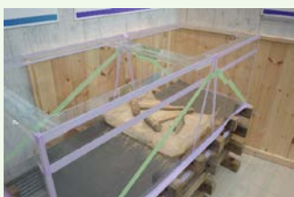
ダム模型施工着手前

三国川ダムは来年でダム建設から30年の節目を迎えます。その節目の取り組みの1つとして昨年度から 情報館のリニューアル を行ってきました。今回のリニューアルでは主にパネルの更新と ダム模型の作製 を行いました。このダム模型はダム建設当時と 同様の材料・施工方法 で、当時ダムの施工に携わっていた方と地元の 桑原建設(株) に製作していただきました。