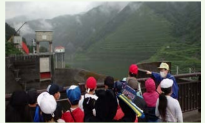
非常用洪水吐付近