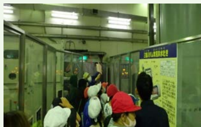
常用洪水吐ゲート室