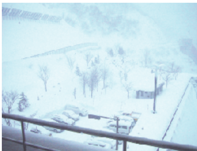
げんとう た 厳冬の中、木々も寒さに堪えて、 春が来るのをジッと待っています