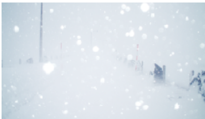
てんば もうふぶき 一変、雪が降るとダム天端は猛吹雪。フロントガラスに吹きつける雪でワイパーは効かず、 目の前は真っ白になりとても恐いです。ポールを頼りにたどり着いた時はもうグッタリ！