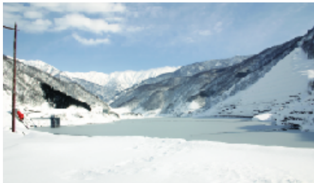
ふぶ 湖に向かって吹雪くため湖面は おお 雪に覆われてしまいます