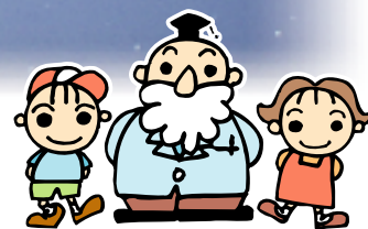
さぐくん さぐり博士 りっちゃん