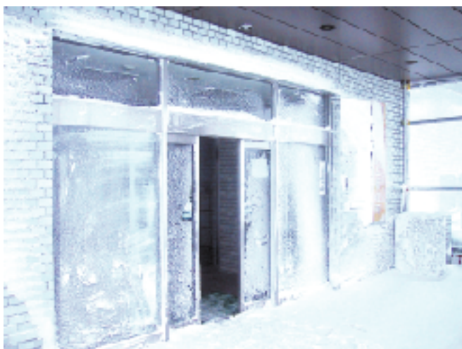
ふぶき こお 吹雪で凍り付く正面玄関