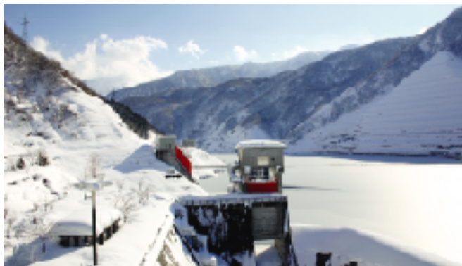
おだ 晴れた日はこんなに穏やかな様子ですが…