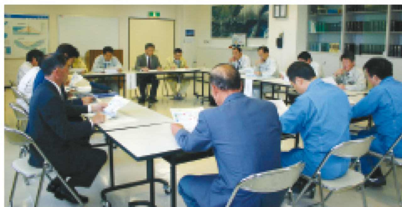
関係機関連絡会議

また同日は、三国川ダムにおける19年度の工事関係者を集めて、安全ミーティングも開催しました。工事中の労働災害防止を目的に、発注者と施工者から労働災害の状況報告、事故対策への取組みを紹介され、それぞれが工事への安全意識を高めました。