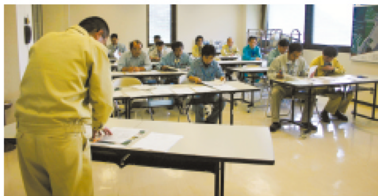
安全ミーティング