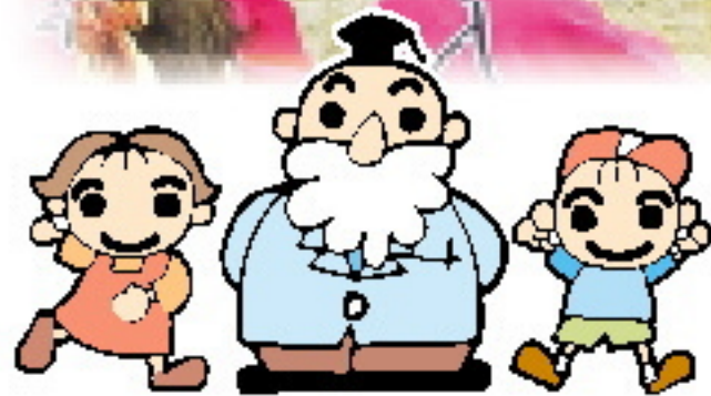
りっちゃん さぐり博士 さぐくん