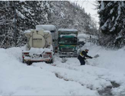
H30. 2. 6