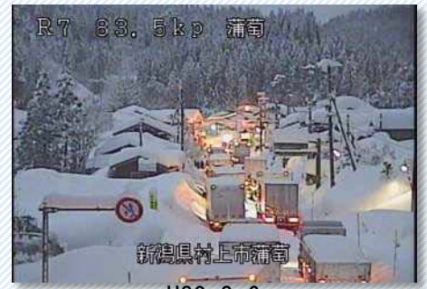
H30. 2. 6