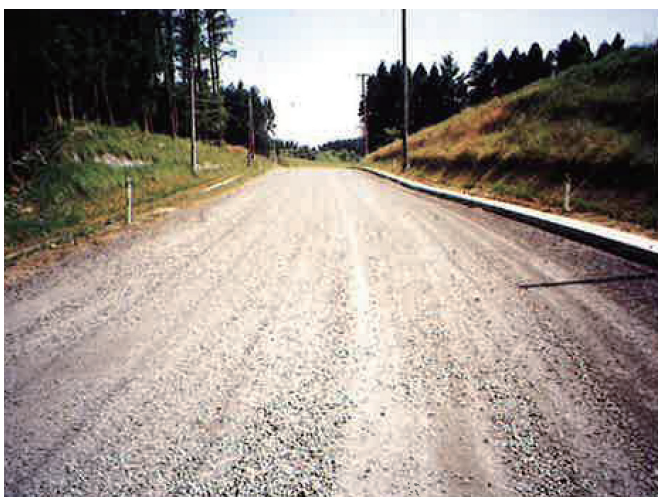
③路盤改良工事完成後