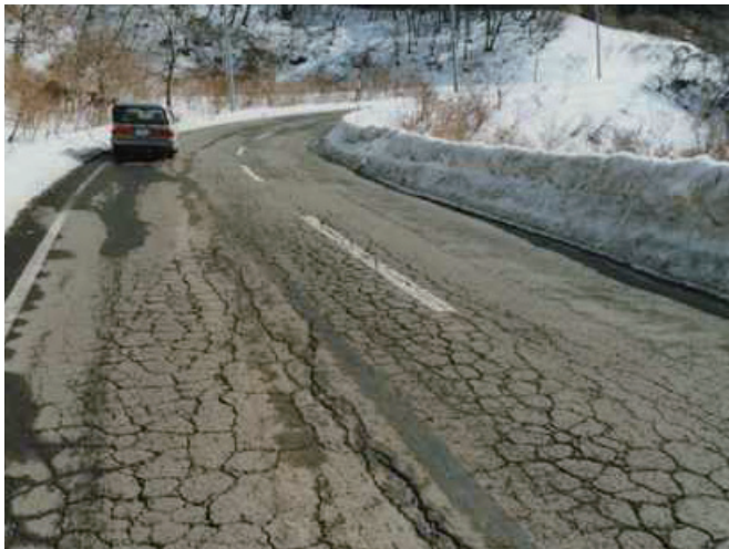
①凍上現象による道路舗装面のひび割れ発生（凍上災）

路盤改良工事には、凍結しにくい材料(砂利など)に入れ替える置換工法、水の移動を防ぐ遮水工法、冷気が土壌に入るのを防ぐ断熱工法などがあります。