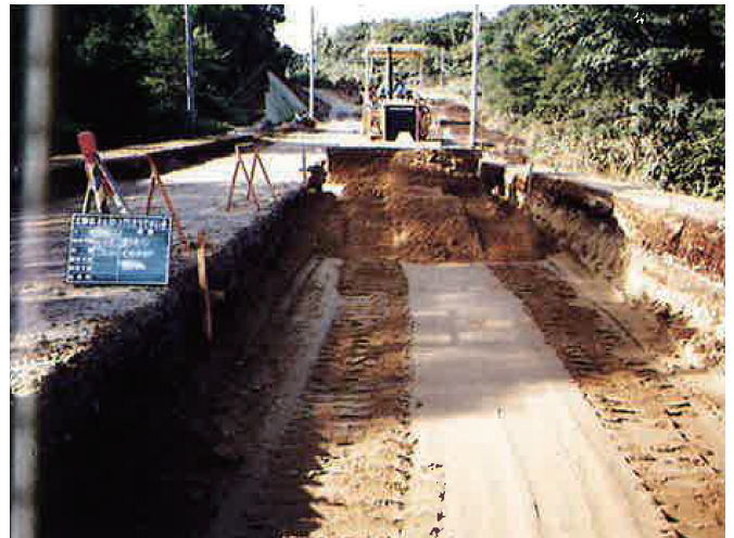
②路盤改良工事の状況