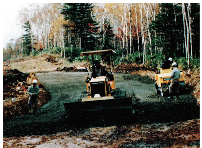
④路盤改良工事の状況