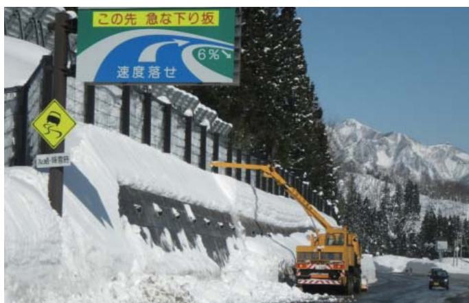
雪庇処理車による作業