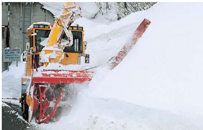
ロータリ除雪車による作業