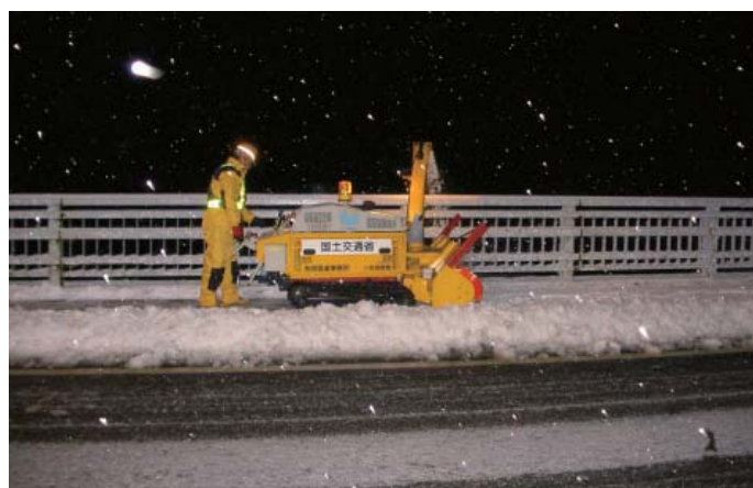
小形除雪機による作業