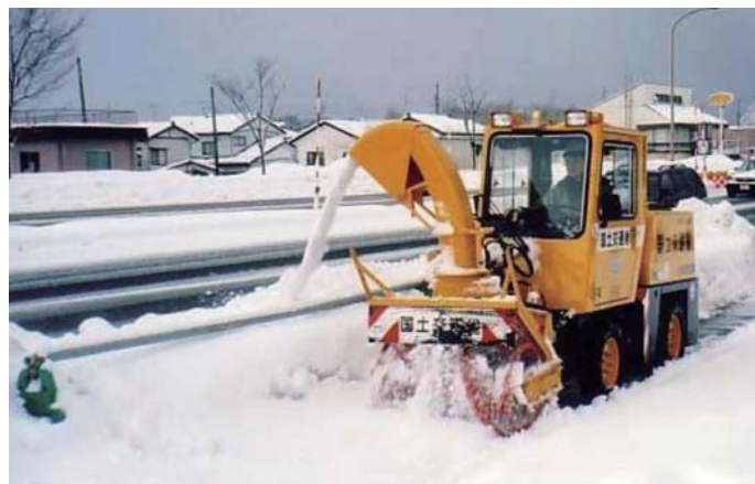
小形除雪車による作業