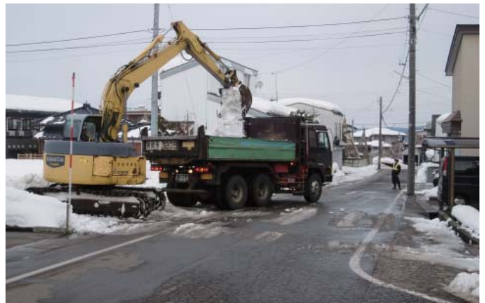
バックホウによる積み込み作業