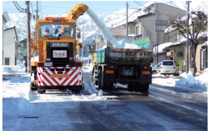
ロータリ除雪車による積み込み作業