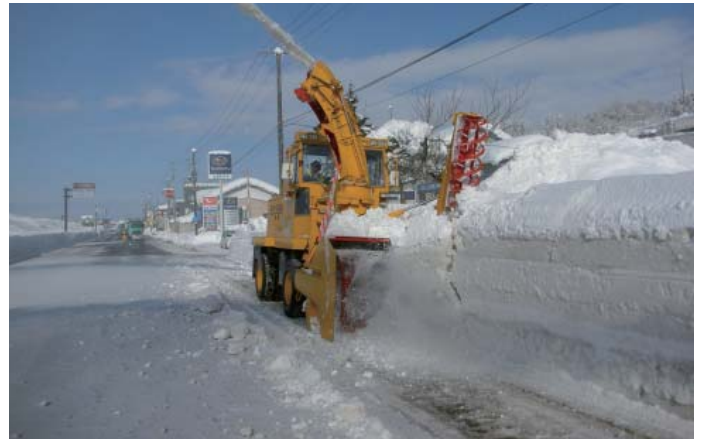
ロータリ除雪車による作業