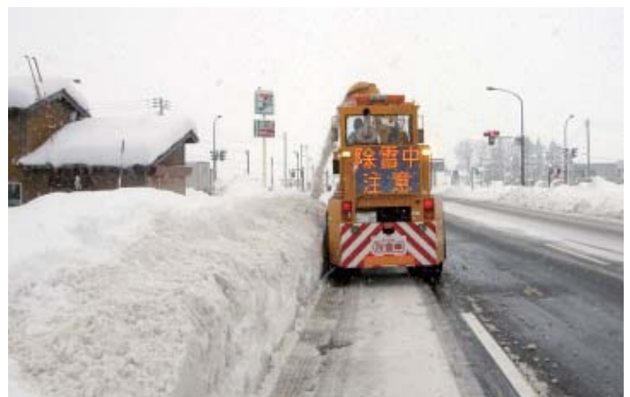
ロータリ除雪車による作業(拡幅後)