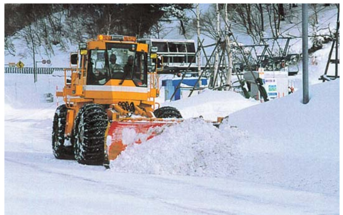
除雪ドーザによる作業