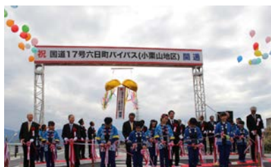
テープカット・くす玉開披