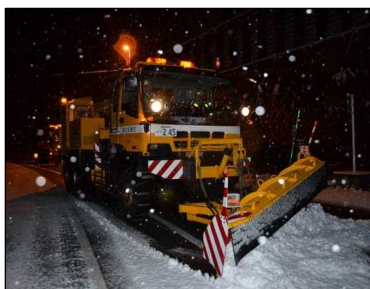
除雪車初出勤 国道17号新潟県湯沢町(H24.11.15)

URL : http://www.hrr.mlit.go.jp/road/kiroku/kiroku.html