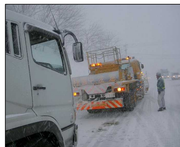
登坂不能車の牽引 国道17号新潟県長岡市(H25.1.25)