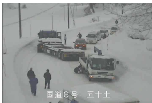
立ち往生車両による交通障害状況(H24.1)