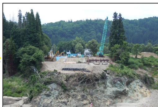
左岸から右岸（至会津若松市）方向を望む