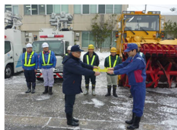
除雪機械の自治体貸与(新潟県上越市)