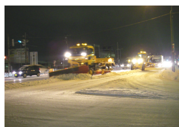
夜間除雪作業(石川県金沢市)