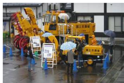
はたらく車(除雪車)展示

※ITS スポットサービスの詳細は国土交通省 ITS スポットの HP をご覧下さい。