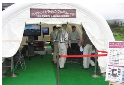
ドライブシミュレーター体験