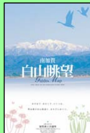
【風景街道周遊マップ】