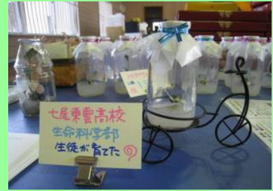
【育苗ポットの製作】