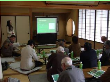
【外国語講座の様子】