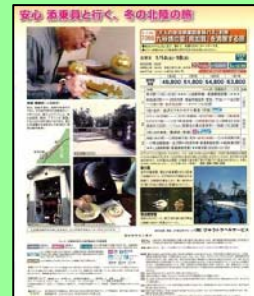
【ツアー商品紹介チラシ】