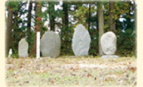
うつだいまようじんひ 宇津大明神碑

宇津峠頂上には「宇津大明神碑」「道普請供養塔（天保6年～弘化2年まで行われた記念碑）」等の石塔群が観られます。