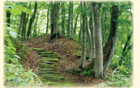
くろさわとうげ 黒沢峠

黒沢峠は苔むした敷石が3600段続いたしへの道。四季折々の姿で楽しませてくれる絶景の峠道です。