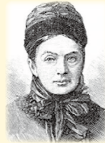
イザベラ・バード

イザベラ・バード イギリスの女性旅行家で明治11年に街道を旅しました。「東洋のアルカディア」と表現した景観があります。