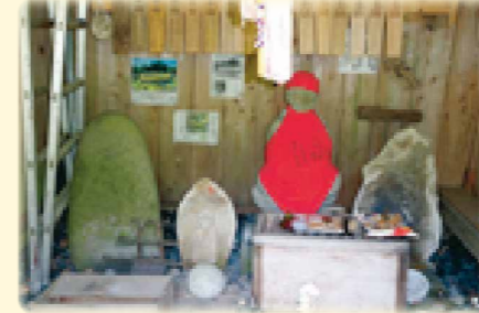
おおりとうげ 大里峠の地藏様

大里峠頂上の地藏堂内には「大里大明神」「峠の地藏様」「観音様」が祀られています。