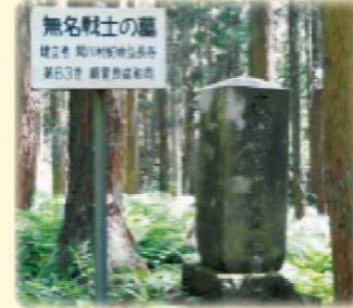
むめいせんし 無名戦士の墓