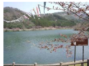
【鯉そよぐ新穂ダム】