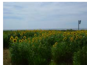
【休耕田に咲く向日葵】