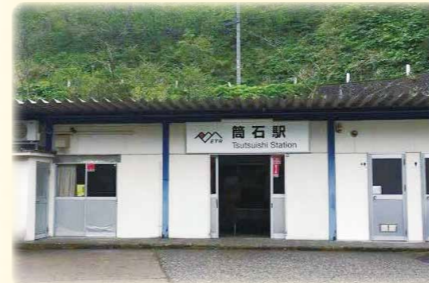
つついしえき ちか 筒石駅（地下ホームの珍しい駅）

国道をそれて回り道に入ると、春には枝垂れ桜が出迎えてくれます。枝垂れ桜と棚田の風景が訪れる人の心を癒やします。茅葺き屋根の古民家と枝垂れ桜と一緒に楽しめます。