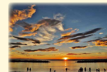
(撮影場所：瀨波温泉)