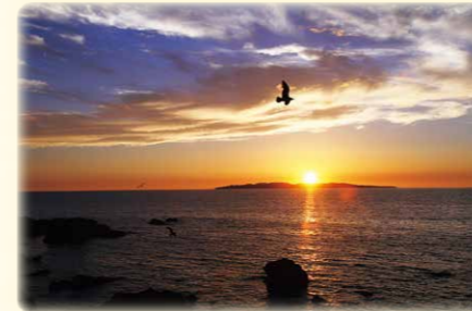
ささがわなが 笹川流れ