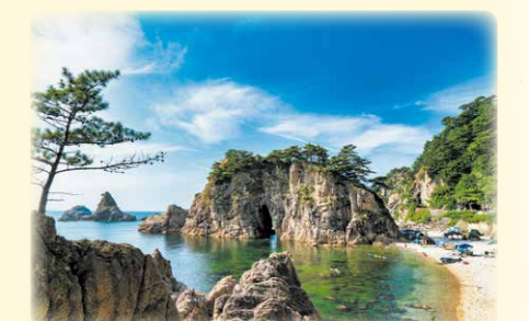
(撮影場所：笹川流れ)