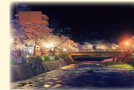
(撮影場所：あつみ温泉)