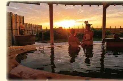
せなみおんせん 瀨波温泉

国の名勝天然記念物（県立自然公園）に指定されており、今や美しい海の代名詞といってもいい、見事な景観を誇る延長11kmの笹川流れ。鑑賞に値する美があります！