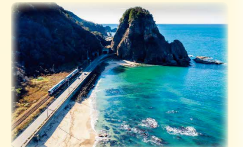
(撮影場所：笹川流れ)