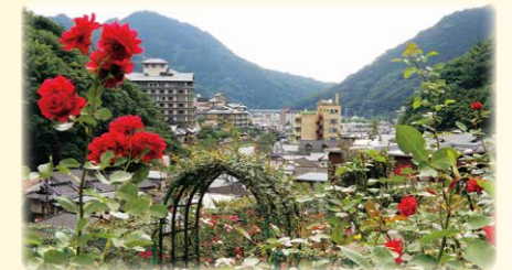
おんせん あつみ温泉ばら園

あつみ温泉ばら園には、約90種3,000本のバラが植栽されています。6月から10月まで次々と咲くバラを見ることができます。毎年6月には「ばら園まつり」が開催されます。