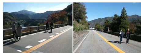
昨年のウォーキングイベントの様子