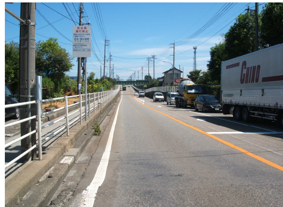
富山市側から新潟県側を望む