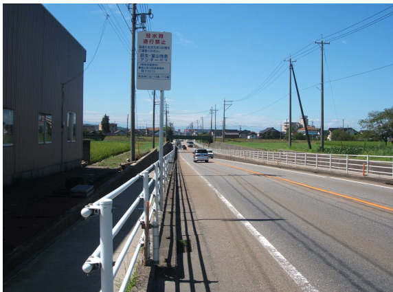
新潟県側から富山市側を望む