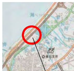
道路冠水想定箇所