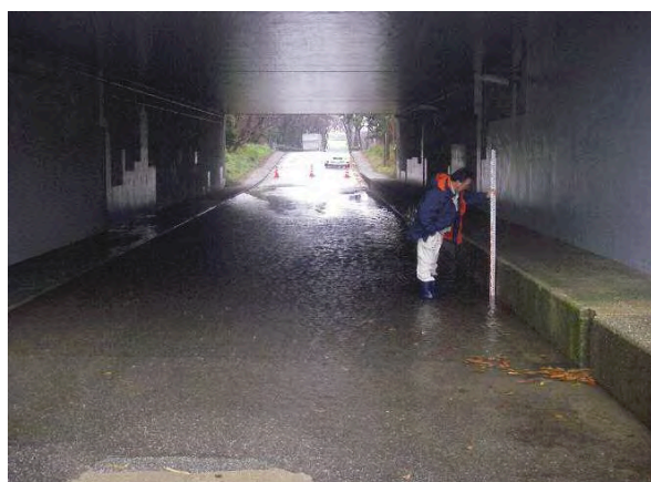
冠 水 状 況 (H20. 12. 5撮影)