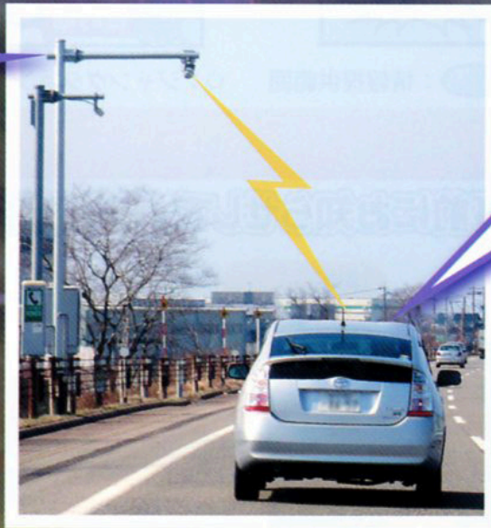
ITSスポット対応カーナビ