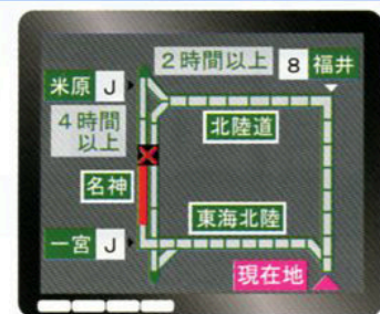
ITSスポット対応カーナビでの表示例