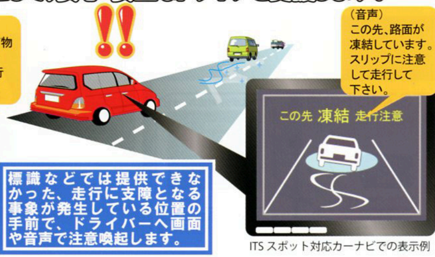
ITSスポット対応カーナビでの表示例