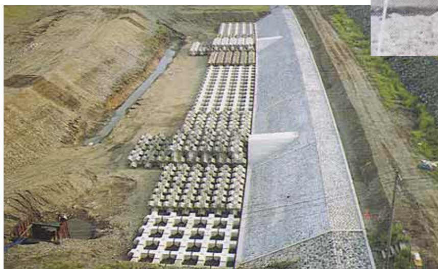
根継ぎ護岸(工事中) 近年の河床低下により、既存の護岸が河床より浮き上がり、危険な状態になっているため、根継ぎ護岸を施工しています。