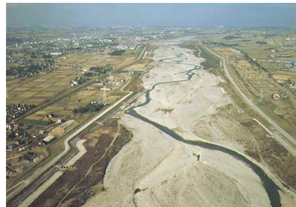
常願寺川の中流部