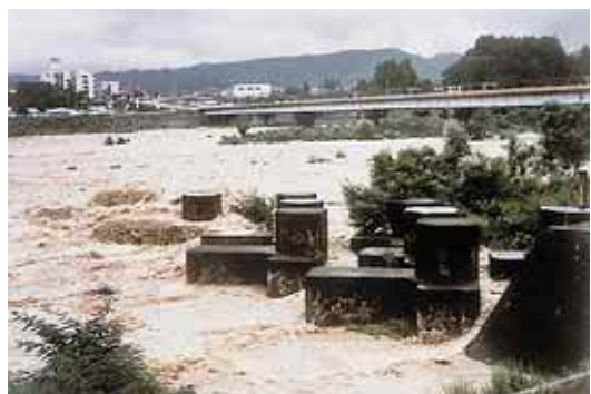
洪水時流水をはねているピストル型水制

このように、急流河川の中・下流部は、上流からの土砂生産の影響を受けやすく、河相の変化が著しい不安定な河道となりがちです。