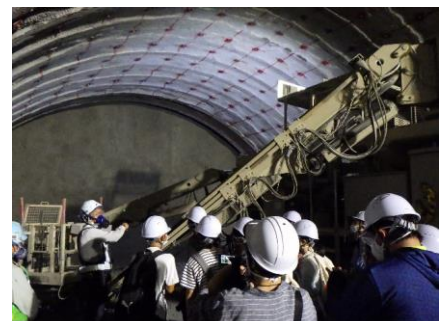
トンネル機械の説明