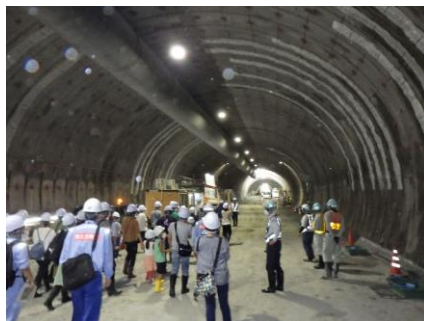
トンネル内見学の様子