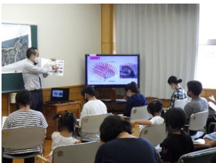
トンネル施工方法の説明