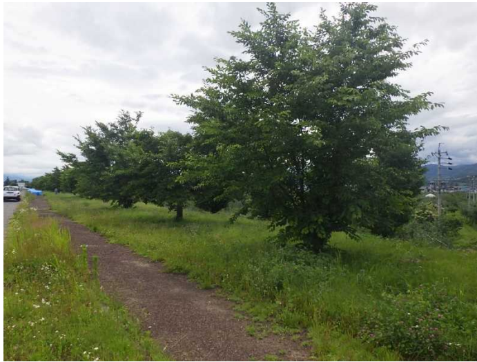
現在の桜の木の状況

プロジェクトにも位置づけられている、「堤防強化」の工事に先立ち、令和3年8月23日より工事範囲内の桜つつみの桜を工事範囲外への一旦仮移植を開始します