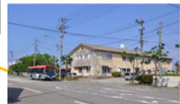
新潟交通(株)入船営業所