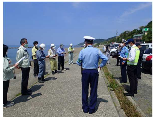
合同現地調査の様子