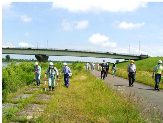
点検の状況(信濃川:新潟県)