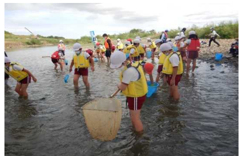
川にすむ生きものを採集