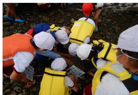
採集した水生生物を判定