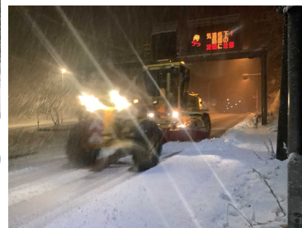
除雪グレーダ ふくとり 国道49号阿賀町福取地先