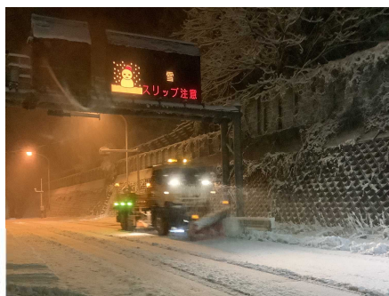
除雪トラック ふくとり 国道49号阿賀町福取地先