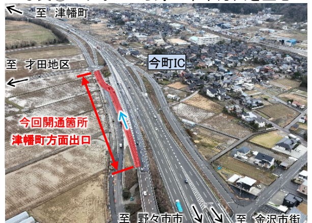
写真② 野々市市方面から今町ICを望む