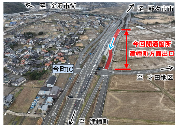
写真① 今町ICから野々市市方面を望む