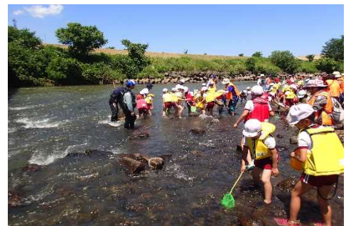
川にすむ生きものを採集