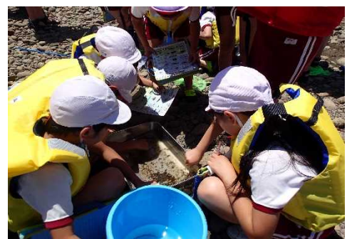
採集した水生生物を判定