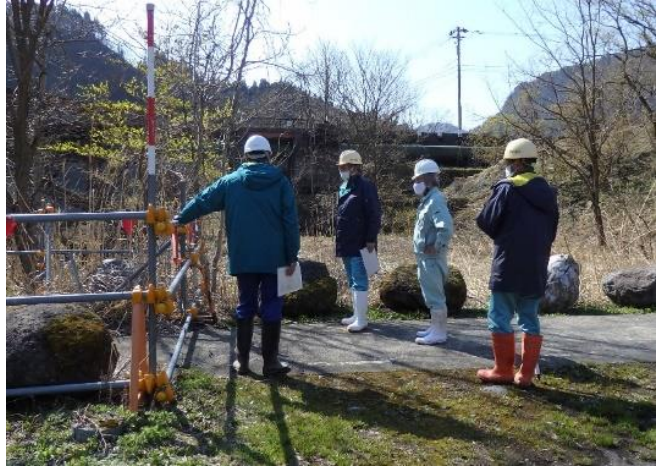
安全利用点検を行う参加者 (千寿ヶ原緑地公園)