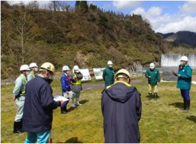
参加者10名での点検前の行程確認 (常願寺川水辺の楽校)